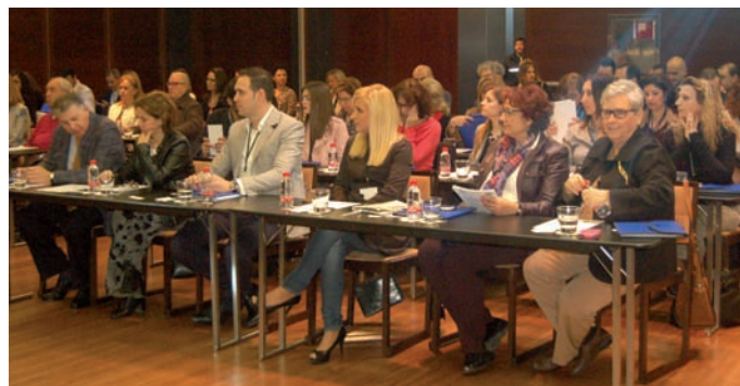
Presidente del Consejo Escolar de la Región de Murcia, la Directora General de Planificación Educativa y RR.HH., y delegados de ANPE.

Así mismo, estamos en plena negociación de la nueva Ley de Función Pública, que debe recoger con rigor las situaciones y necesidades de todos los sectores, al tiempo que la mejora de la calidad del servicio público que prestamos. Debe resolver todas las expectativas y necesidades de todos, sin generar situaciones de discriminación. En este sentido continuaremos demandando igualdad de derechos cuando se habla de carrera profesional del profesorado. Como también el derecho al cobro del verano por parte de los interinos, o el reconocimiento del profesorado de Religión de su derecho a percibir los Sexenios. Queremos dotar a la Región de Murcia de la calidad educativa que merece".