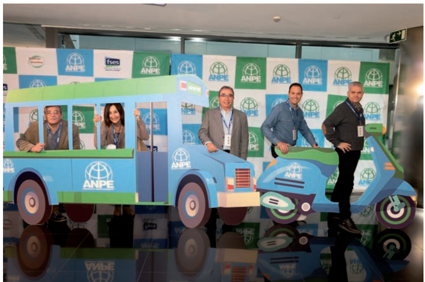
ANPE Murcia en el IX Congreso Nacional