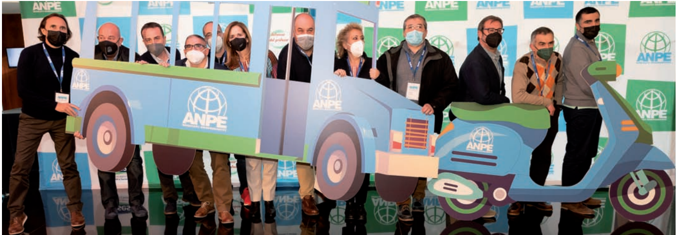
Delegados de ANPE Religión de distintas CC.AA.

Desde que ANPE asumió la Presidencia del Comité de Empresa del Personal Laboral Docente de la CARM, una de nuestras principales reivindicaciones ha sido la de que se agilicen los trámites de contratación del Profesorado de Religión necesario para cubrir las bajas y sustituciones. Lo hemos conseguido.